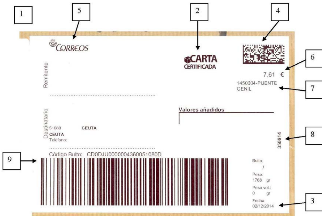
Etiqueta térmica Zebra GX420d, tamaño grande, empleada para el franqueo de un envío certificado de hasta 2 kg de peso desde la oficina de Correos de Puente Genil.